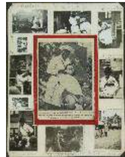
Plakboekpagina's 19 t/m 22