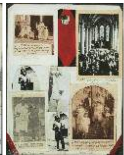
Plakboekpagina's 11 t/m 15