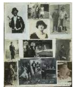
Plakboekpagina's 2 t/m 4