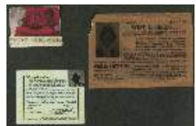
Plakboekpagina's 23 en 24