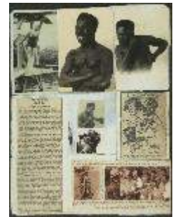
Plakboekpagina's 5 t/m 10